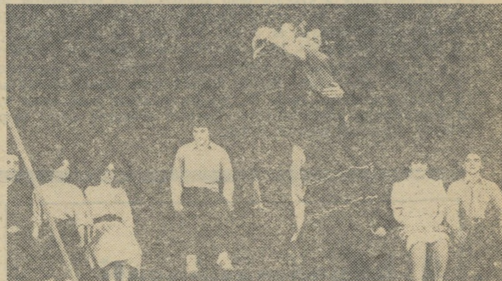
A Falusi randevű egyik változata