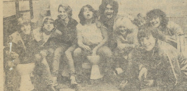
Holdbéli csónakosok Ubü király díszletai között