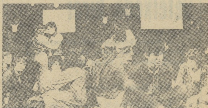
A béceiek Pop-fesztivál-ja