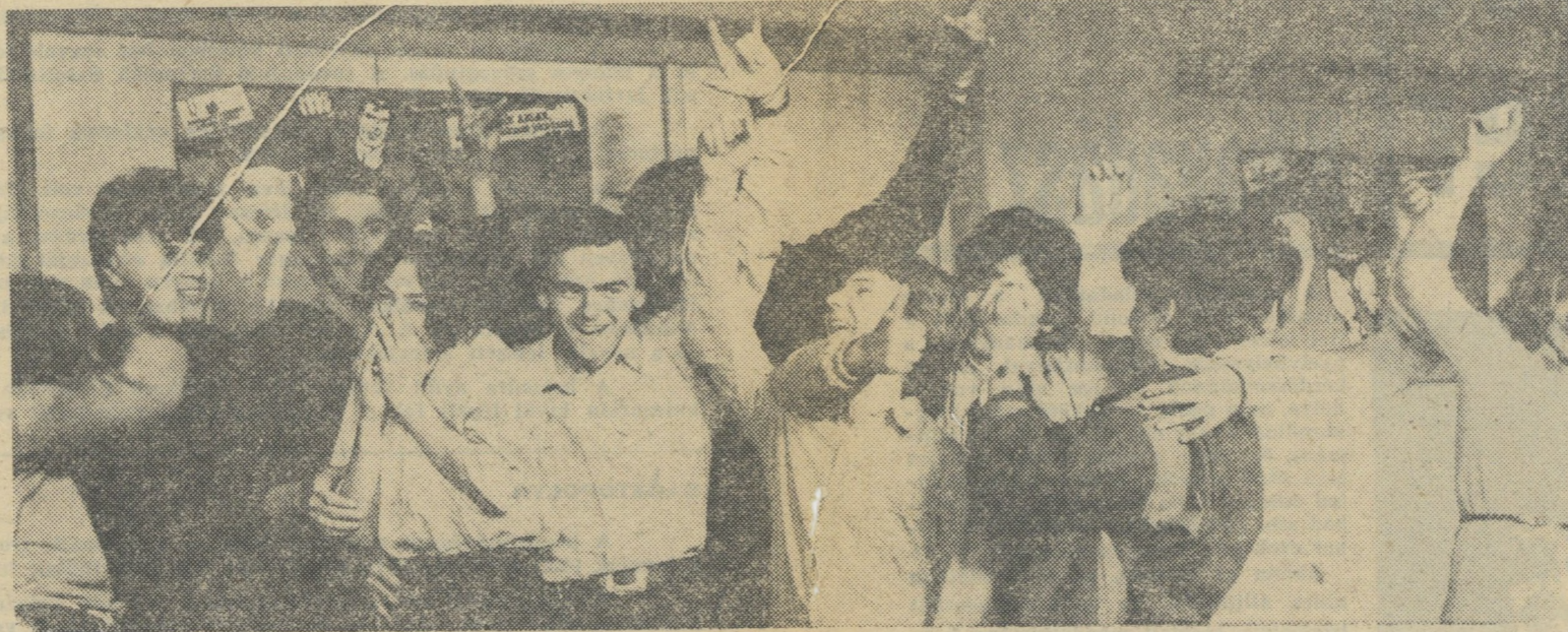
A győztesek öröme