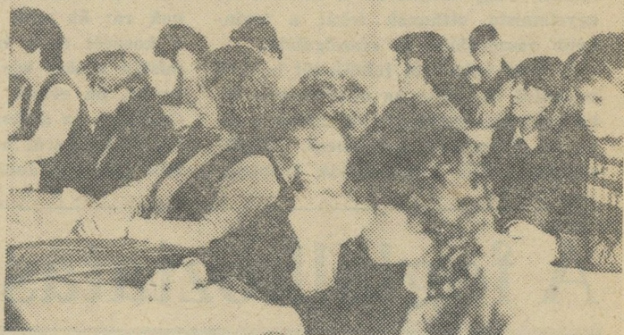
...és a zrenjanini körzeti versenyről

A Középiskolások XVIII. Művészeti Vetélkedőjének április 11-én megtartott zrenjanini zónaversenyén 28 diák mutatta be tudását a vendéglátó Nikola Tesla Építészeti és Elektronikai Középiskola dísztermében.