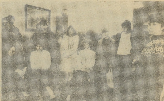
Pillanatkép az újvidéki...