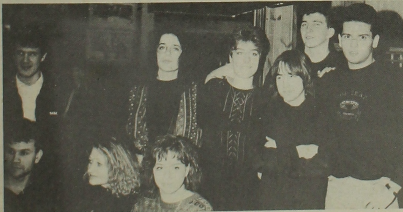
Az újvidéki együttes