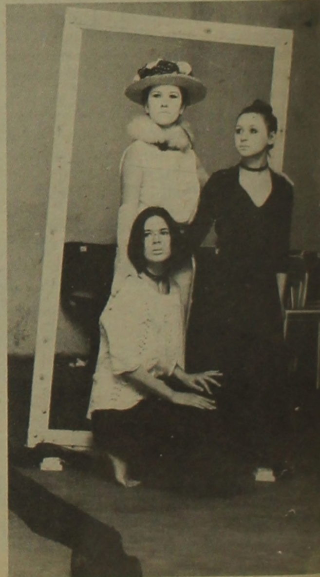
A szabadkai Svetozar Marković Gimnázium színjátszó csoportja a