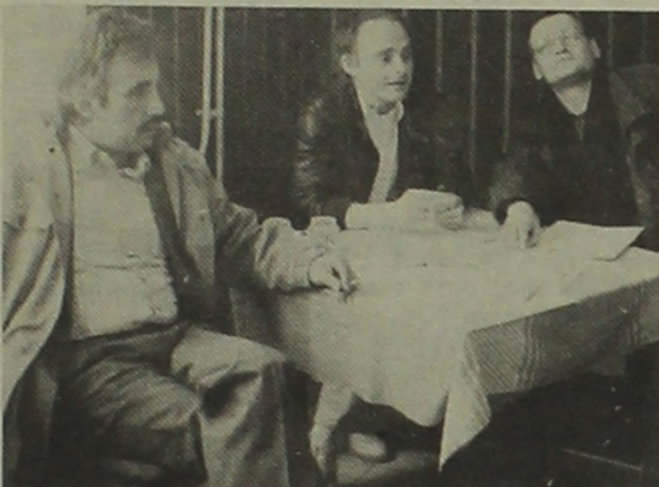
Értékel a zsűri

szórakoztatni akaró színpadi produkciót. Minden csoport az életről, az élet értelméről, vagy értelmetlenségéről, az élethez való viszonyulásról, az élet túlélésének módusairól készít képet, alkot véleményt, hogy tudunk egymással, egymás mellett megenni, egymást nem bántva élni, és ami még lényegesebb, tették ezt a napi politika bármilyen vetületétől mentesen, ami pedig a mai légkörben egyáltalán nem lényegtelen. Ezek a fiatalok, Kosztolányi, Eörsy, Lorca, Jódal vagy Tolnai segítségével,