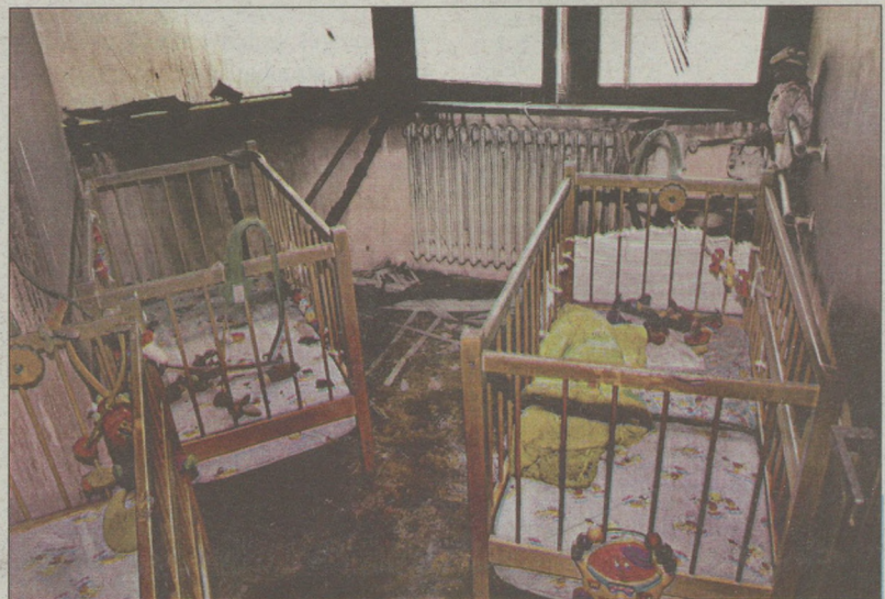
Ez maradt az egyik szobából

Öt gyermek vesztette életét tegnap egy szarajevói árvaházban keletkezett tűzben. A boszniai főváros központjában fekvő, Ljubica Ivezić gyermekintézményben reggel hatkor csaptak fel a lángok. A rendőrség tájékoztatása szerint a tűz a harmadik szinten keletkezett, és gyorsan átterjedt három olyan szobára, ahol a kisebb gyermekek aludtak.