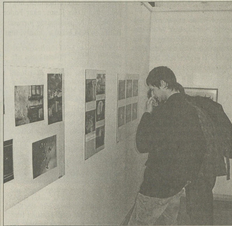
A műsor mellett a kísérőrendezvények is színvonalasra sikeredtek