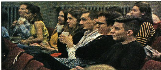
A közönség egy része