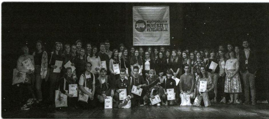
A Középiskolások Művészeti Vetélkedője díjazottjai között a Műszaki Iskola diákjai is helyet kaptak